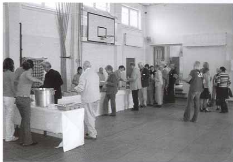
Catering met muziek.