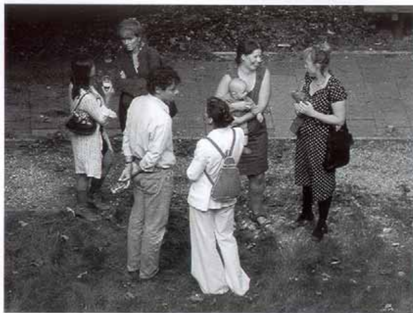
Een wel zéér jonge reünist...