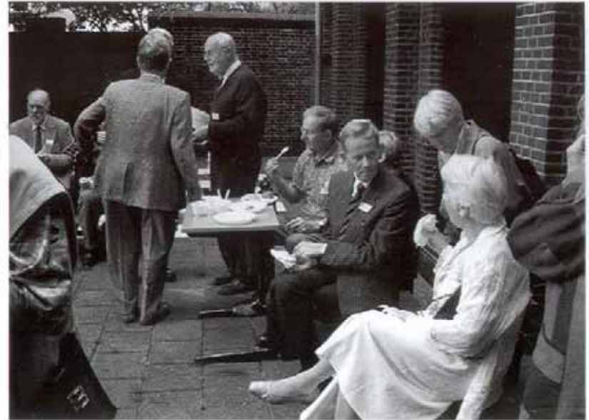
Lunch in de tuin.

Naschrift van de redactie: Wie levert een adequate vertaling in het Nederlands ? Om het niet al te eenvoudig te maken: rijm en metrum dienen gehandhaafd te worden. Reacties gaarne aan de abactis van Socialiter.