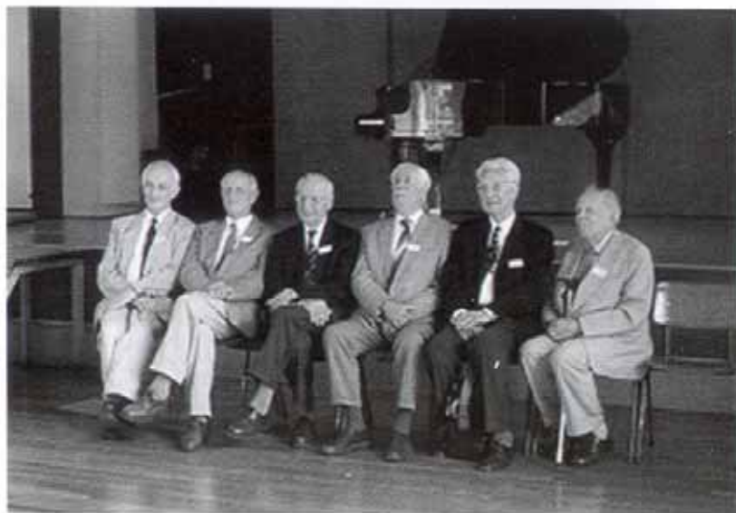
... en de seniores.