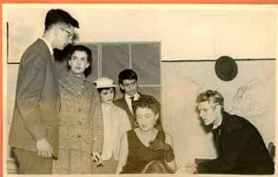
De Spooktrein, maart 1958