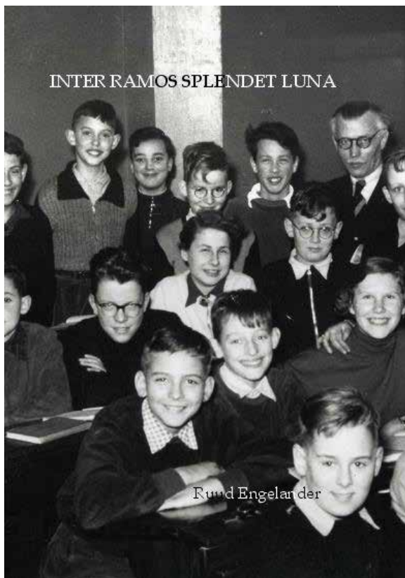
Inter Ramos Splendet Luna, 2009

Voor alle duidelijkheid: ik herinner me de dingen zoals ik ze hier heb opgeschreven, maar dat wil niet zeggen dat alles waar is. Je geheugen speelt je parten en de jaren waarover ik heb lagen op het moment van schrijven een halve eeuw achter ons. Het is mijn versie van mijn jaren op het Haganum en iedereen draagt een andere versie in zich. Ook ikzelf. Ik realiseerde me dat ik ook een ander verhaal had kunnen vertellen, met deels dezelfde, deels andere mensen en gebeurtenissen, soms misschien minder luchtig, minder braaf en minder fatsoenlijk. Maar dit is wat het is geworden.