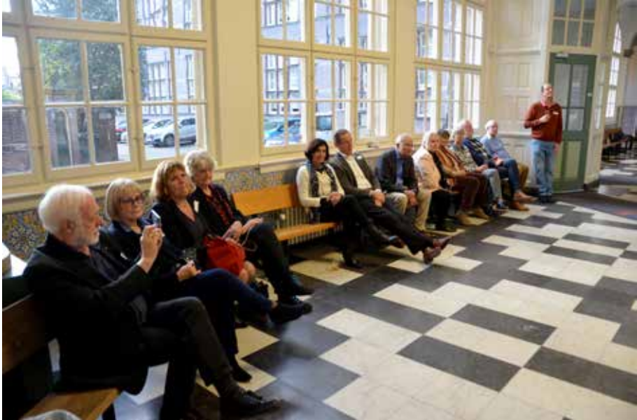
reunie examenklassen '68-'71

Hieronder volgt een greep uit de fotohoek van Socialiter. Dit fotoboek staat online en is te vinden op het volgende adres: https://socialiter.piwigo.com