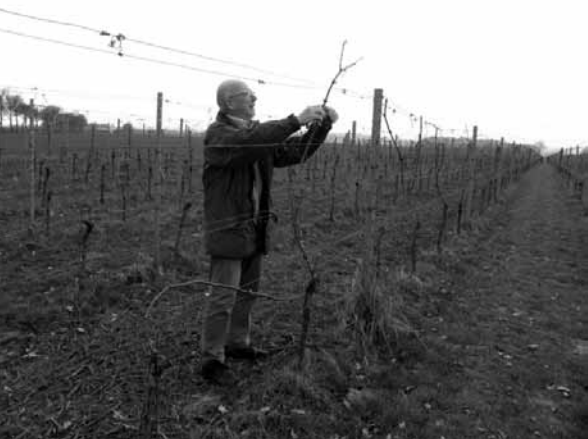
WINTERSNOEI IN DE WIJNGAARD.

Een vertrouwensrelatie tussen ouder en kind is belangrijk. Mijn ervaring is dat het met eersteklassers nog wel meevalt. Daarna wordt het soms 'lastig'. Vanaf de vierde klas worden leerlingen zelfstandig en ontwikkelen zij zich tot persoonlijkheden. In 1999 is het studiehuis geïntroduceerd. Leerlingen moesten het zelf uitzoeken, leraren kregen een sturende en stimulerende taak. De resultaten waren erbarmelijk: veel leerlingen konden de 'vrijheid' niet aan. Van het studiehuis is iedereen nu wel teruggekomen. Het enige goede ervan vind ik het in groepjes van twee of drie maken van een profielwerkstuk. Op het Gymnasium Haganum is de Romereis een hoogtepunt in het schoolleven van een leerling. Het is opmerkelijk hoeveel meer aandacht onderling en creativiteit de voorbereiding van deze reis losmaakt. Een kritiekpunt dat ik heb is de veranderende opstelling van ouders. Bescheidenheid, een objectieve maat en het open staan voor kritiek zijn ver te zoeken wanneer het eigen kind in het geding is. Dit is een zorgelijke ontwikkeling.